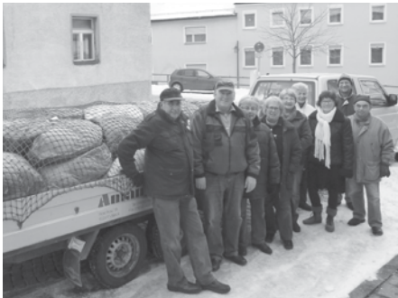
Mitglieder der Kolpingsfamilie Vilseck holen Material zur Verwertung. Mit dem Erlös helfen sie.

Was vor rund 20 Jahren für eine kleine Gruppe von Interessenten begann, ist inzwischen zu einer Institution geworden. Der erste Bedarf